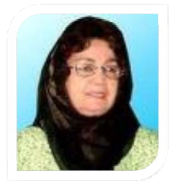
هاگن) کشور دنمارک

را نامبرد که کنفرانس سوسیا لستی زنانی 17 کشور جهان را در شهر (کوپن