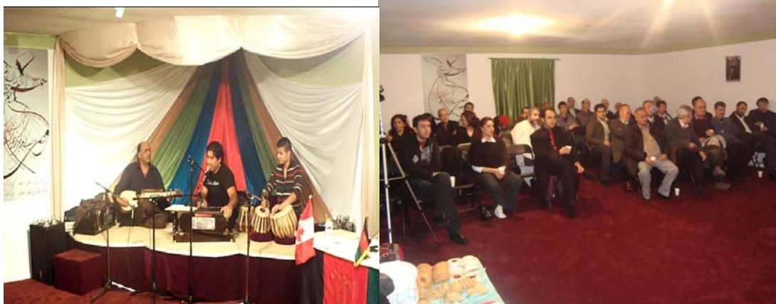
(اشتراک کنندگان برنامه (شب مولانا)